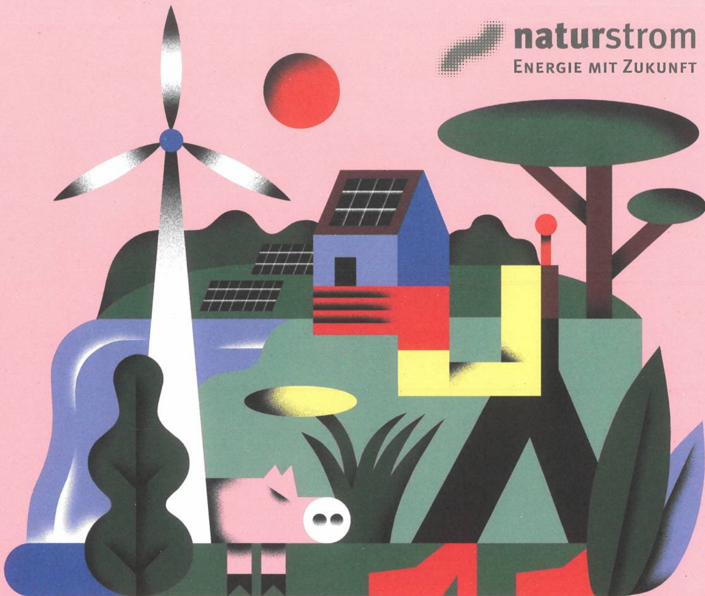
Illustration: ZEBU, Berlin